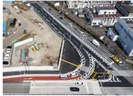
工事発注機関: 国土交通省 関東地方整備局 工事件名: R1 国道357号東京湾岸道路夏島地区道路改良