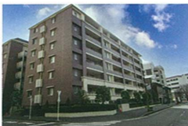
社員Aさん自宅マンション