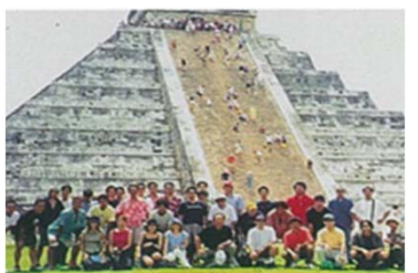
創業10周年メキシコ チェチエン・イツツァ遺跡にて