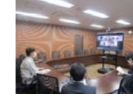
社内勉強会は、各職責に合わせてグループ毎に行います。(現場職員はリモートにて参加します。)

新入社員教育はもとより、在籍社員の勉強会、資格取得指導にも積極的に取り組み、社員と共に成長する企業を確立していきます。懇切丁寧な指導をモットーとして日常的に行われるロールプレイングや月に一度の勉強会、外部研修やセミナーの受講も積極的に取り組んでいます。