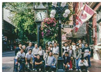
創業7周年カナダ バンクーバーにて