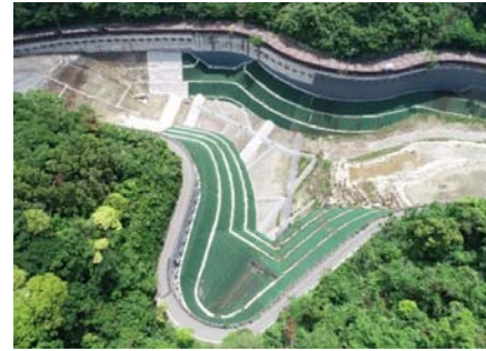
工事発注機関: 神奈川県環境農政局 工事件名: 平成31年度かながわ環境整備センターしゅ水施設整備工事