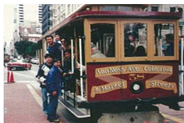
創業3周年米サンフランシスコにて

社内コミュニケーションや豊かな人間形成を促す為、最高レベルの体験を求めチョイスしています。