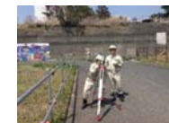
新入社員教育(現場視察)