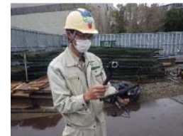
ウェアラブルカメラによる現場管理を実践しています。