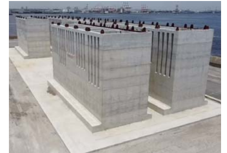
工事発注機関: 横浜市港湾局 工事件名: 新本牧ふ頭建設工事(その19・ケーソン躯体工)