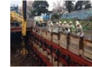
新入社員教育(現場視察)