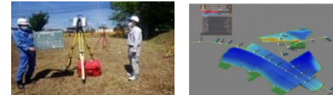
TLSIによる測量等、IoT技術の導入を率先し、活用しています。