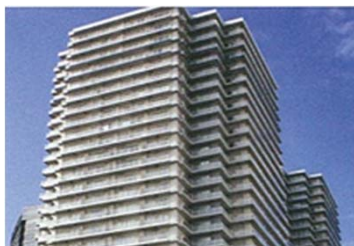
管理職Bさん自宅マンション

社内報奨金・社内貸付金制度 担当するプロジェクトの成績により大型報奨金を贈呈。また車の購入や緊急医療等出費が見込まれる際には金利0%貸付を行っています。