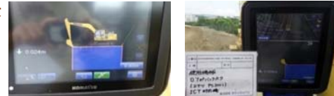
ICT建機の使用等、ICT技術の導入を率先し、活用しています。